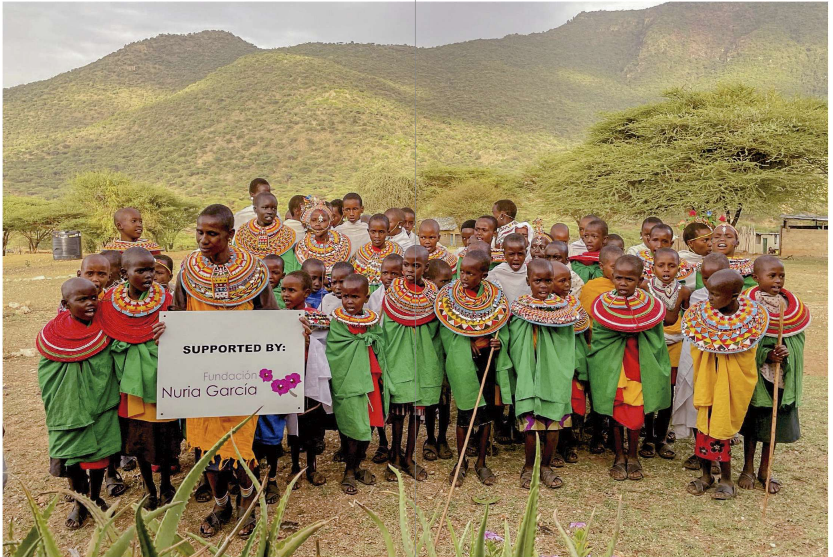
"En cada niño nace la humanidad"