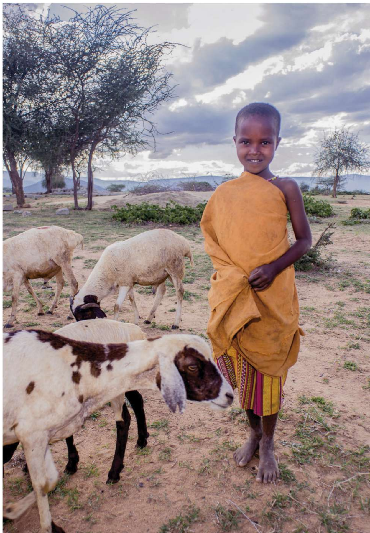
"Nunca es demasiado tarde para empezar de nuevo" - Jane Fonda -