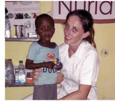
Guinea Bissau, 2018